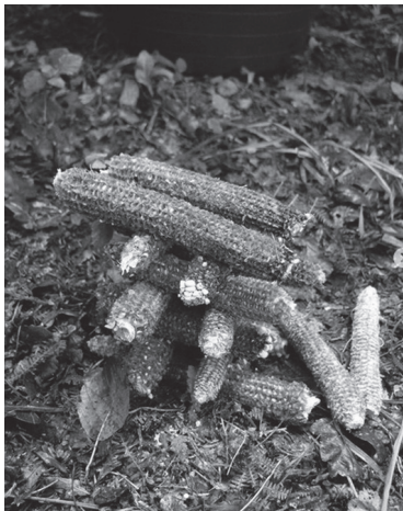
Castelo de carozos.