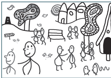
Aldea de Xes.

III. Coidado e custodia do territorio: parte dos proxectos céntranse no esforzo por protexer comunidades e territorios de ameazas ambientais e sociais relacionadas co extractivismo forestal ou enerxético.